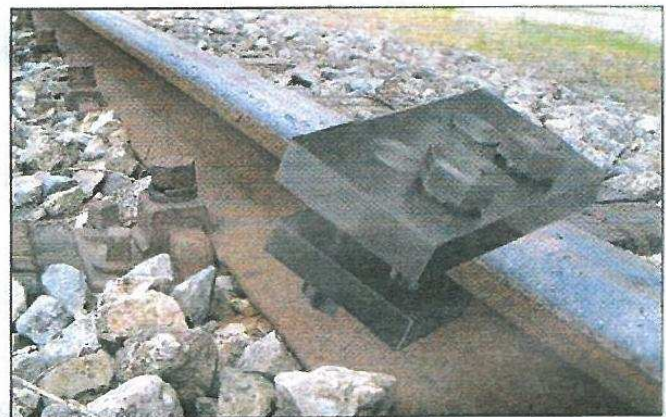
Situation der Klammer, die aus normalem Stahl und Edelstahl hergestellt wurde.