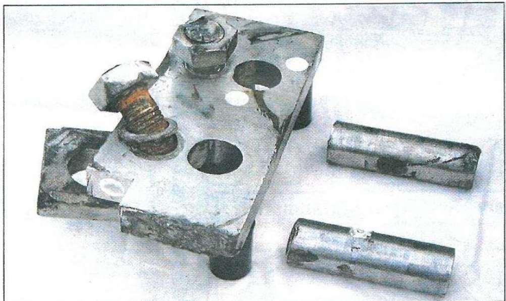
Das Foto zeigt die gefundenen Originalgegenstände aus Wesel - Feldmark.